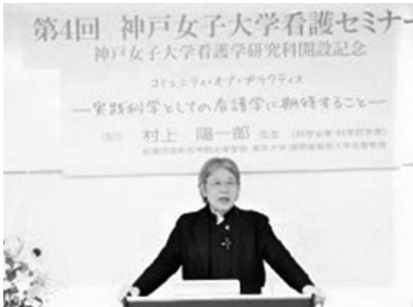
写真 1 (特別講演の様子)

家族の理解ではないこと、根源的な、人間の魂の奥底にあるものが発露のように湧き出てきたものであることが、看護学生のエピソードから伝えられた。医療は、病気を治す、病気の苦しみを取り除くことだけでなく、患者の死に対しても関わらなければならない、その場においても共感や物語の共有が重要になってくると説かれ講演を終えられた。